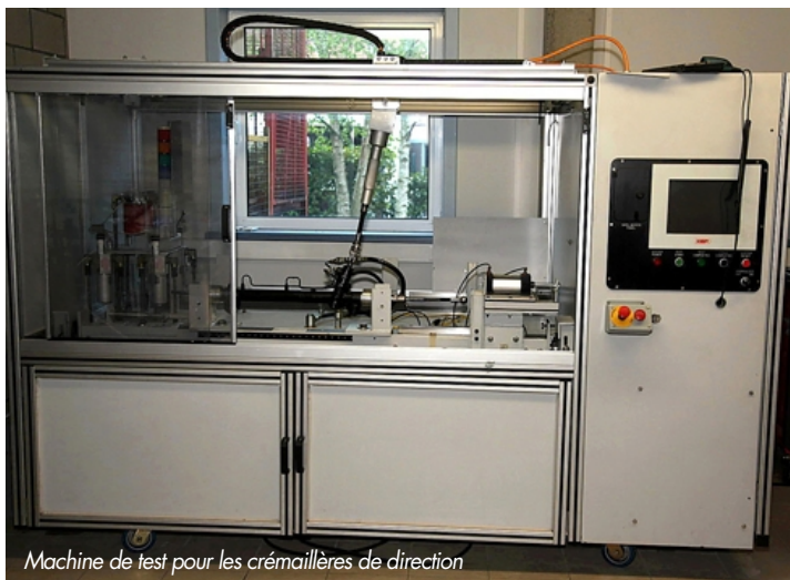
Machine de test pour les crémaillères de direction